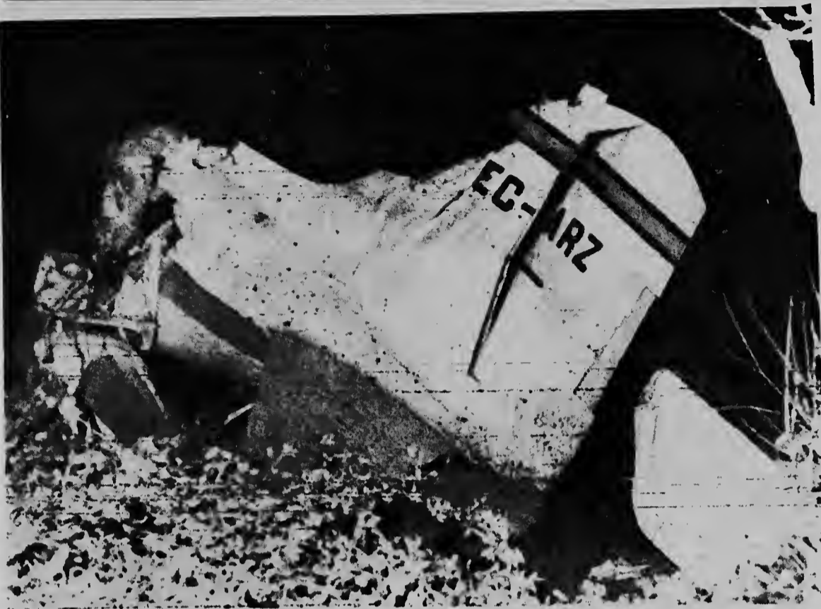
SANTA CRUZ DE TENERIFE -- Riba e foto nos por mira restu di e avion DC-3 cu a cai djies despues cu el a lanta vuelo for di e aeropuerto. Tur e 32 pasaheronan cu tabata a bordo a muri.

PETRONA & CROES ARUBA N.V. Ananastraat 4 Tel 2800